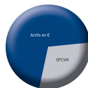
Répartition cible des actifs d'€urythmie