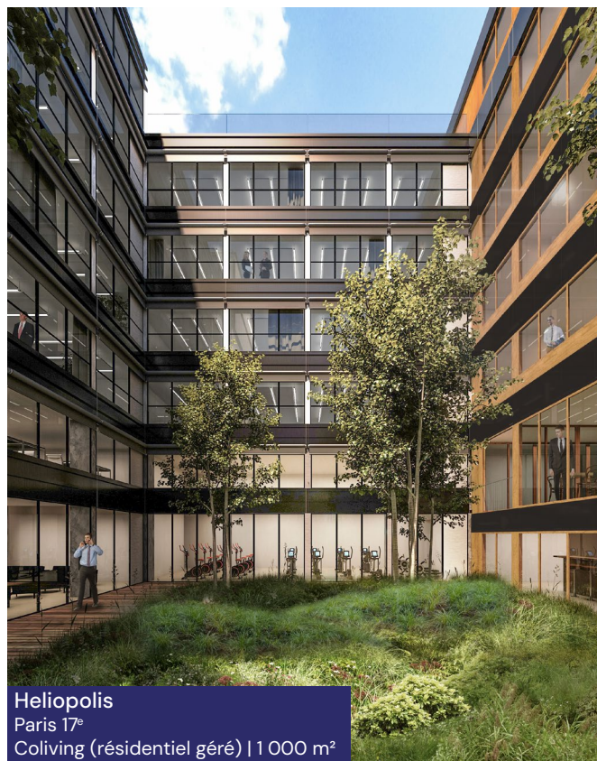
Heliopolis Paris 17 e Coliving (résidentiel géré) | 1 000 m 2