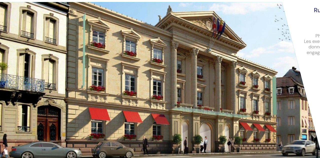
Rue de la Nuée Bleue Strasbourg (67) Hôtellerie | 6 665 m 2

1 Le TOP (Taux d'occupation physique) se détermine par la division de la surface cumulée des locaux occupés par la surface cumulée des locaux détenus par la SCPI. 2 Le TOF (Taux d'occupation financier) se détermine par la division du montant total des loyers et indemnités d'occupation facturés ainsi que des indemnités compensatrices de loyers par le montant total des loyers facturables dans l'hypothèse où l'intégralité du patrimoine de la SCPI serait louée.