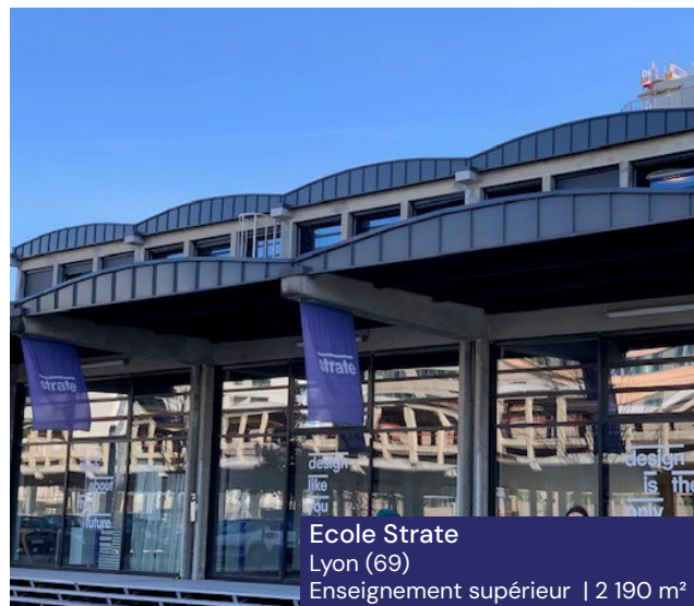
Ecole Strate Lyon (69) Enseignement supérieur | 2 190 m 2

Avec une plateforme européenne de professionnels de l'immobilier , permettant une sélection fine immeubles et des locataires, la SCPI vise à se constituer un patrimoine composé de bureaux, de commerces et de locaux d'activités ou d'entrepôts, mais également de typologies innovantes telles que la santé, l'hôtellerie ou encore le résidentiel géré (étudiant, senior, coliving) en France et dans des États qui ont été membres ou qui sont membres de l'Union Européenne.