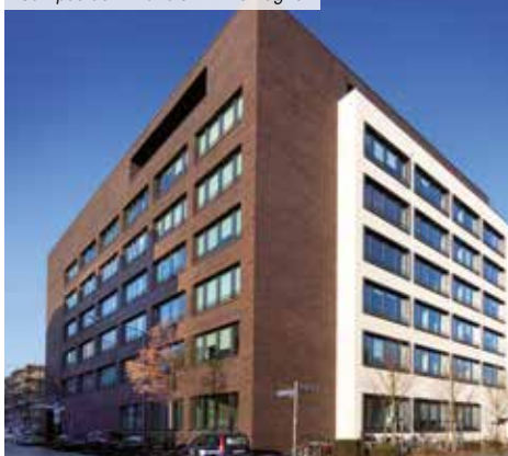
Campus 53 – Francfort – Allemagne

*** Pour les non résidents seuls les immeubles détenus en France sont pris en compte.