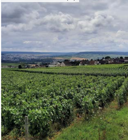
Lieudit Les Tahus - Hautvillers (51)

(3) Disponibles dans le prochain bulletin trimestriel suite à l'arrêté comptable du 31/12.