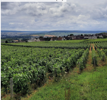
Lieudit Les Tahus - Hautvillers (51)

(2) Disponibles dans le prochain bulletin trimestriel suite à l'arrêté comptable du 31/12.