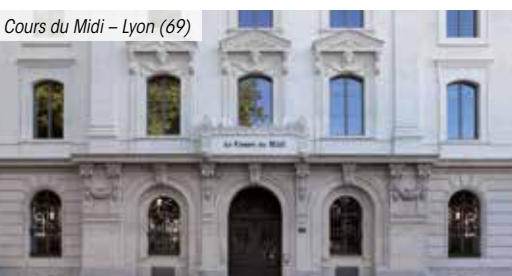
Cours du Midi – Lyon (69)