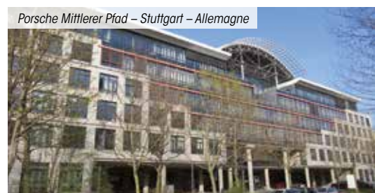
Porsche Mittlerer Pfad – Stuttgart – Allemagne